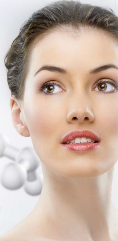
Rózsavíz - Rizsolaj - Sheavaj - Avokádó olaj - Argán olaj - Ligetszépe olaj Búzacsíra olaj - Növényi emulgeátor - Zöld tea kivonat - Ginsenggyökér kivonat - Ribizli olaj - Lötuszvirág kivonat - Szászorszép kivonat Orgonavirág kivonat - Acmella kivonat - Anatto kivonat - Allantoin Lecithin - Urea - Ceramid komplex - L-Prolin - Koenzim Q10 - Fényvédő komplex - Kollagén protein - Vitamin C - Vitamin E - Hialuronsav - Tejsav Rozmaring kivonat Mirhaolaj - Narancsvirág olaj - Rózsafa olaj