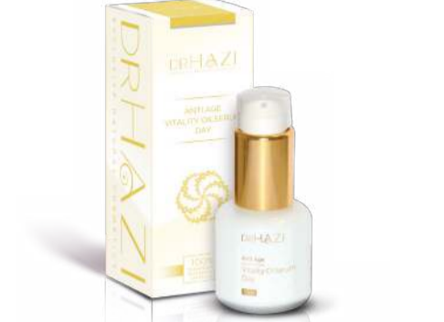
Ghanei fekete szappan - Rózsavíz - Thermál gyógyvíz - Növényi Glicerín Vadrózsa olaj - Argán olaj - Rozmaring kivonat - Zöld tea kivonat - Rózsafa olaj - Levendulaolaj - Növényi emulgeátor - Növényi hidratáló tenzid Xantán gumi

Alapja a természetes fekete szappan, mely gyengéden távolítja el az elhalt hámréteget, anélkül hogy kiszáraitaná az arcbórt. Mélytisztító hatásával segítve a fiatalító hatóanyagok bejuttatását a bőr mélyebb rétegeibe. Stabilizálja a bőr pH-ját. Hidratálja a bőrt. A hozzáadott gyógynövénykivonatok, finom olajok és növényi hatóanyagok gondoskodnak a bőr rétegeinek megújításáról, visszaadva ezáltal a bőr természetes ragyogását és frissességét.