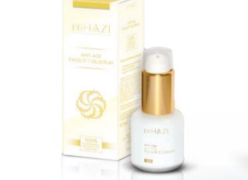
Rózsavíz - Hársfavirágvíz - Zöld tea kivonat - Tigrisfűkivonat - Hibiszkusz-mag kivonat - Sáfrányvirág kivonat - Kollagén protein - Hialuronsav -Urea Meggyamagolaj - Lecithin - Tejsav - Vitamin C - Pálmarózsa olaj - Rózsafa olaj - Patchouli olaj

Az arcápolás második lépéseként előkészíti a bőrt a következő programra, mely lehet az éjszakai vagy nappali ápolás. Alapkozmetikumként alátámasztja és ösztönzi a bőrfunkciókat, erősíti az anyagcsere-tevékenységet, ezzel fokozza a kötőszövetek duzzadóképességét. Minden bőr típusra alkalmas ránctalanító arcvíz. Az olajos szérumok, krémek hatóanyagainak felszívódását nagymértékben támogatja.